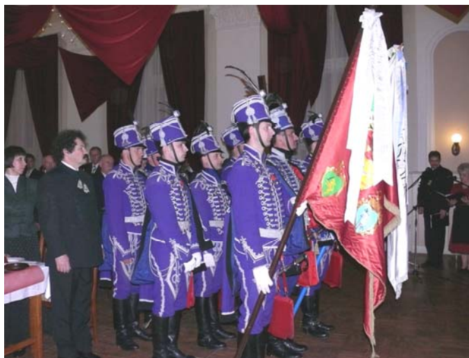
A Nagykun Nádor Huszárbandérium tagjai hozták be a történelmi zászlókat